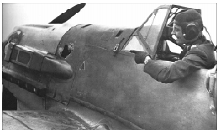
Обер-фенрих Марсель после боевого вылета. Впереди на борту около капота двигателя видна пробоина.