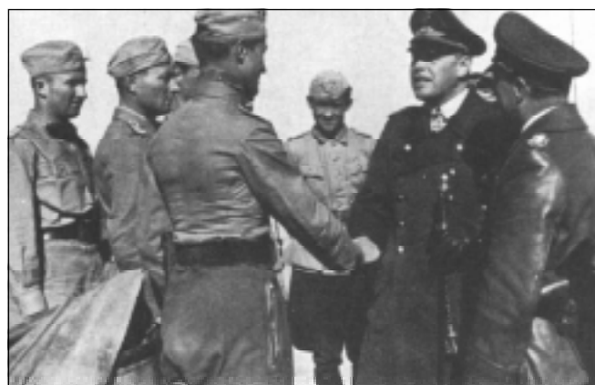
Генерал-фельдмаршал Кессельринг поздравляет лейтенанта Марселля. Крайний слева Арнольд Штахлшмидт, в центре Эдуард Нейман.