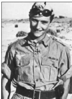
Обер-лейтенант Марселль вскоре после возвращения в Северную Африку. Начало сентября 1942г.