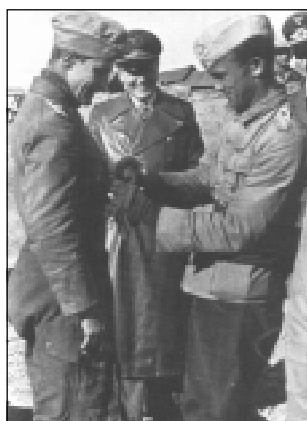
Командир I./JG27 гауптман Эдуард Нейман вручает Марселлю DK-G. 2 декабря 1941г.