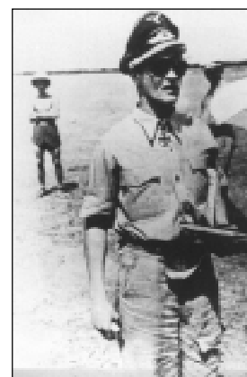
Командир 3./JG27 обер-лейтенант Марсель.