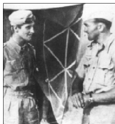
Обер-лейтенант Марсель и командир JG27 майор Эдуард Нейманн.