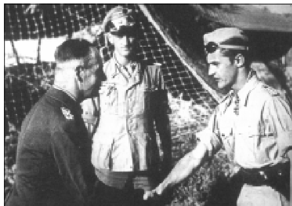
Генерал-фельдмаршал Эрвин Роммель поздравляет Марселля со 150-ю победами.