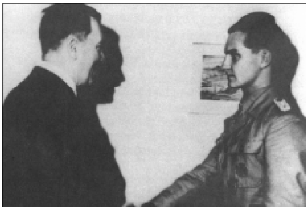
Адольф Гитлер поздравляет Марселля с награждением Рыцарским Крестом с Дубовыми Листьями и Мечами. Конец июня 1942г., Растенбург.