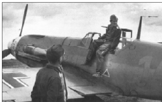
Лейтенант Марсель после своей 50-й победы. 21 февраля 1942г.