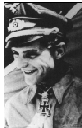
Гауптман Марселль после своей 158-й победы.