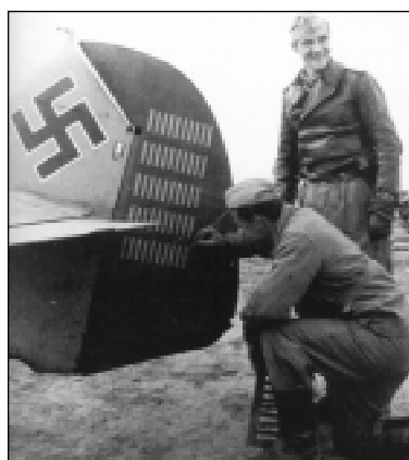
Механик рисует обозначение 50-й победы Марселля. 21 февраля 1942г.